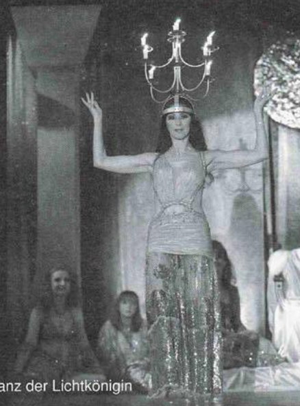
Tanz der Lichtkönigin

Alle Infos unter: www.tamarisk.de Telefon: 069 / 86 28 43